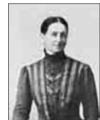
Emma Pieczynska-Reichenbach (1854–1927)